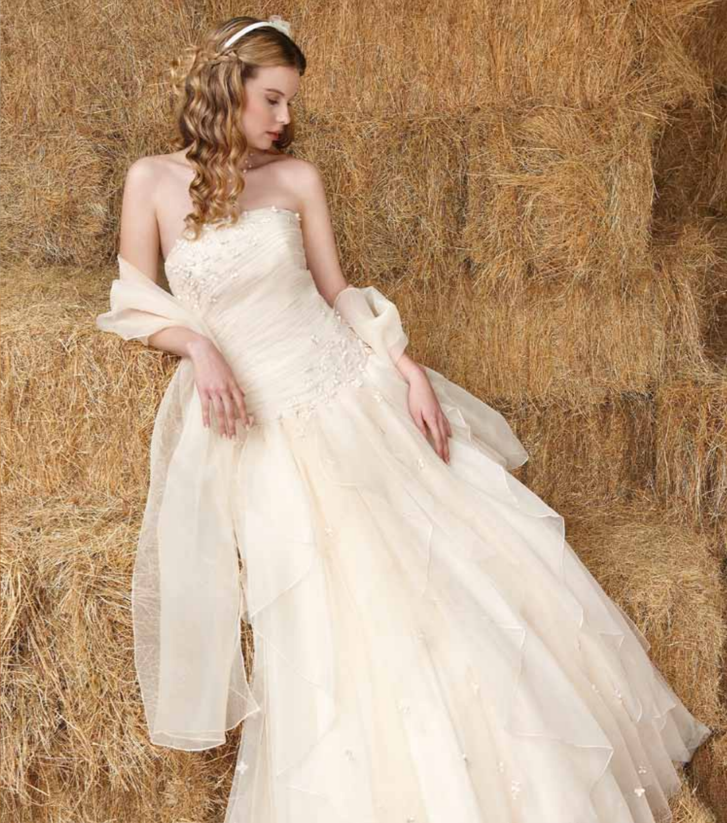
Earl Grey ivoire